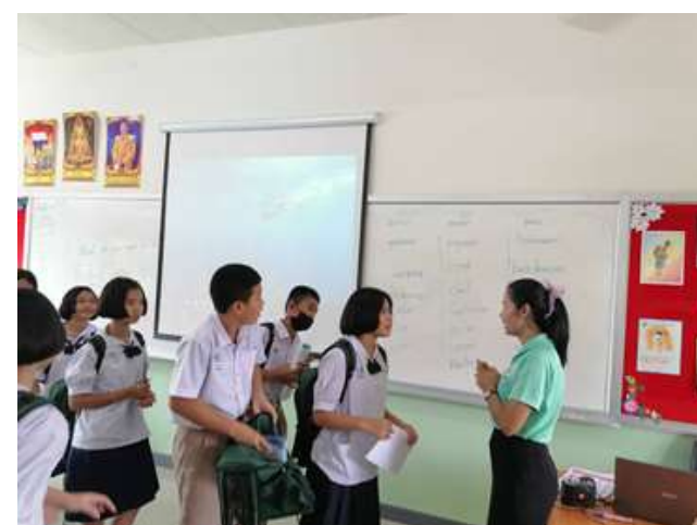
ภาพ PLC Lower Secondary – English วงรอบที่ 3 ตุลาคม 2563) เปิดชั้นเรียนวงรอบที่ 3 เรื่อง What do you want to be? ชั้นมัธยมศึกษาปีที่ 1/1 ห้อง 511